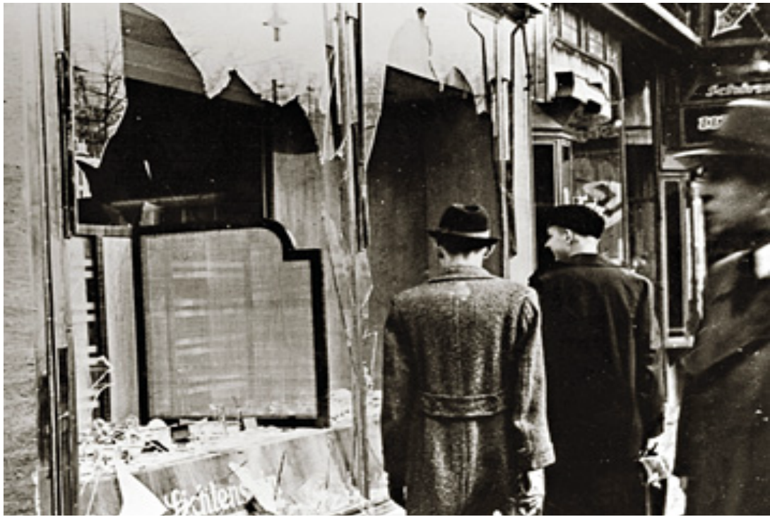
Знищення нацистами єврейської крамниці.

Група учнів-дослідників мали домашнє випереджальне завдання : на конкретних історичних фактах довести антисемітську, протиправну сутність нацистської влади.