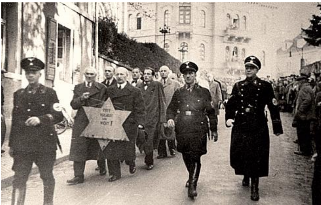
Публічне приниження нацистами євреїв.